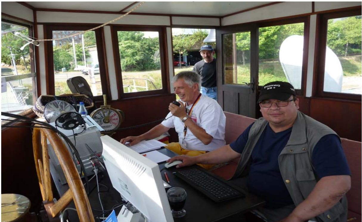
DO9RWG als CoOperateur am PC beim Loggen der einzelnen Stationen vom Deutschlandrundspruch und RLP Rundspruch.