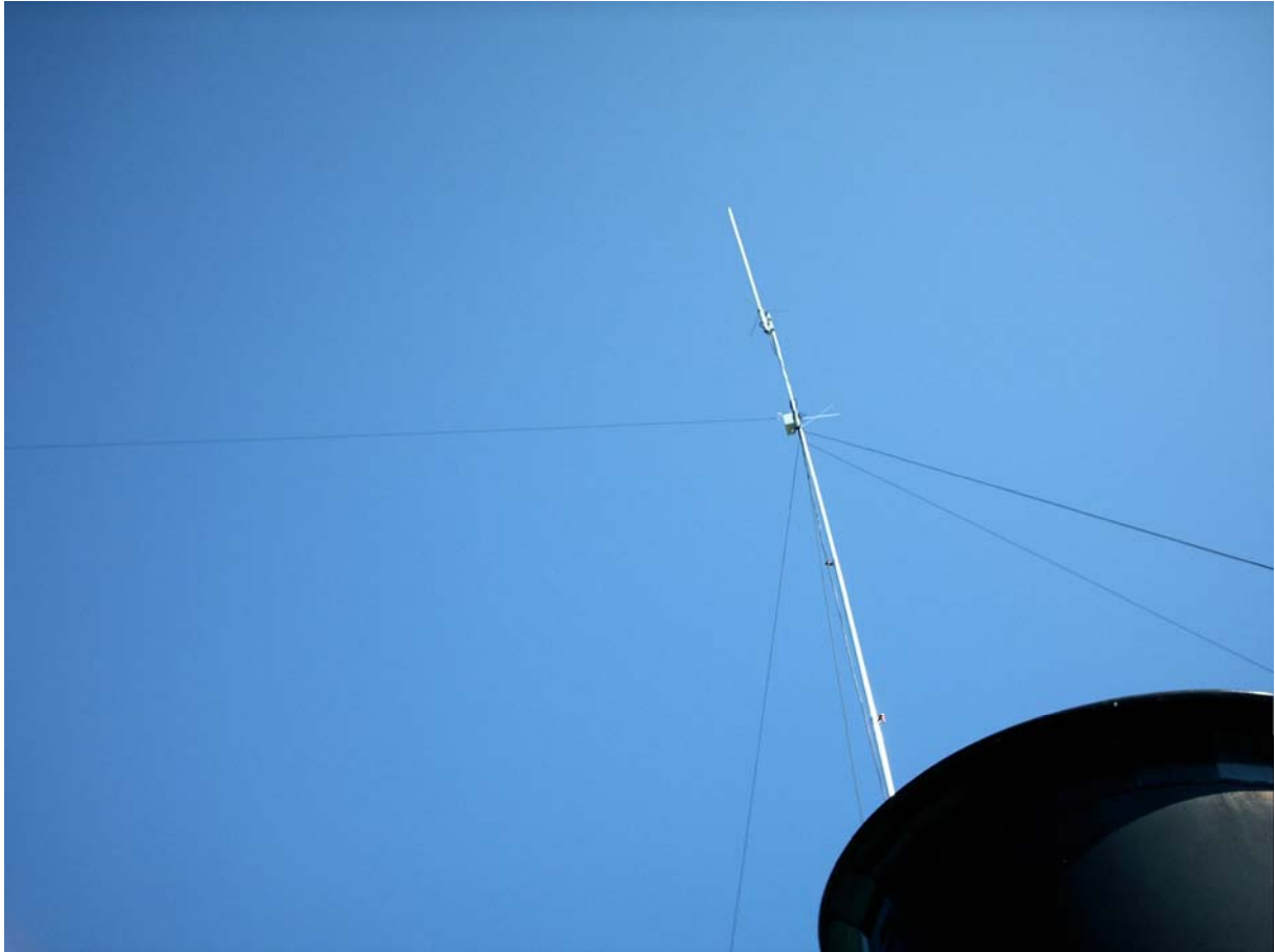
Am Schornstein waren dann die Antennenanlagen befestigt. Ganz oben auf X50 Diamond Rundstrahler für UKW Betrieb. Darunter HighEndFeed Dipol.