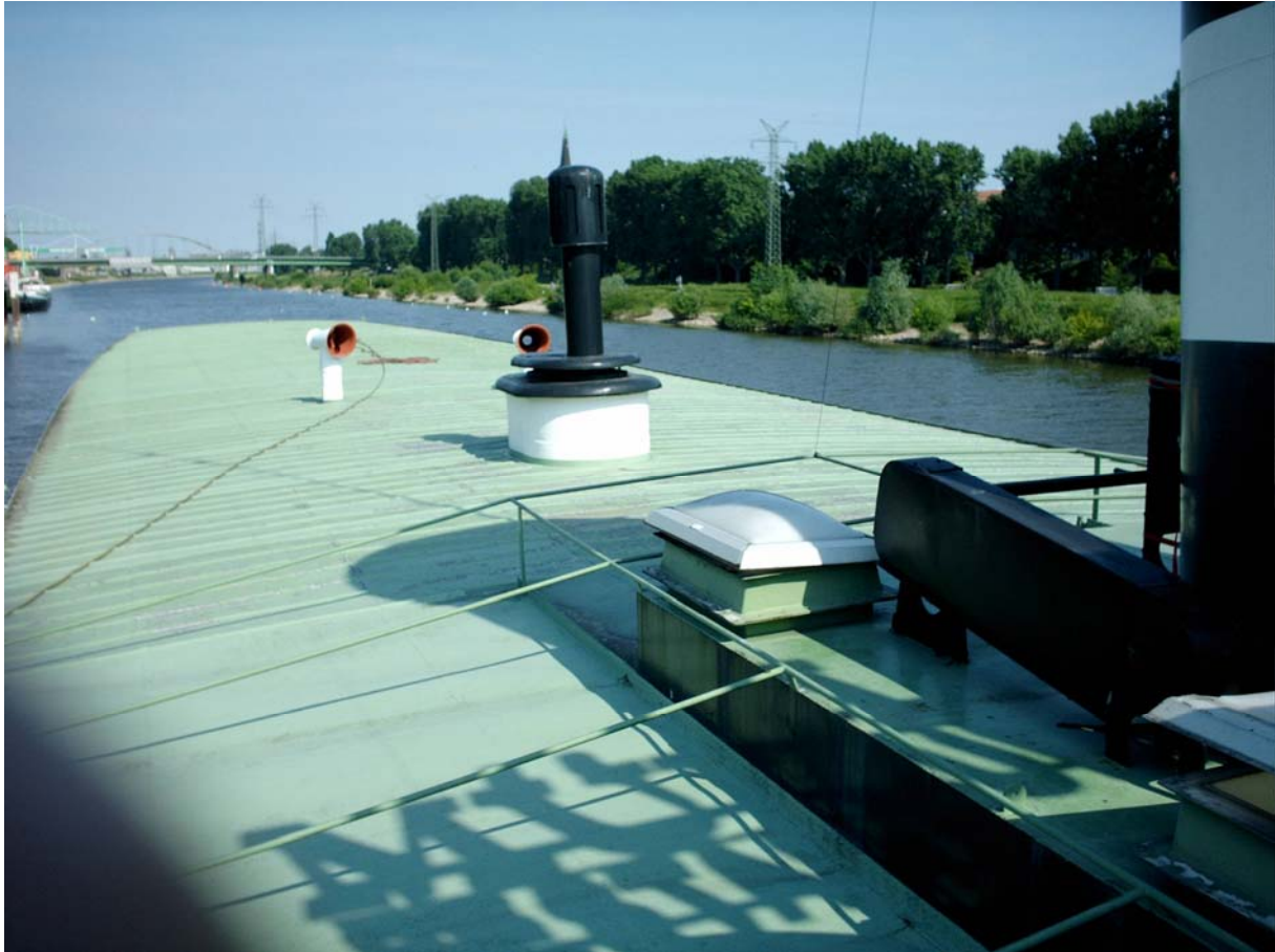
Hier ein Bild vom Heck des Museumsschiffes „Schaufelraddampfer Mannheim“.