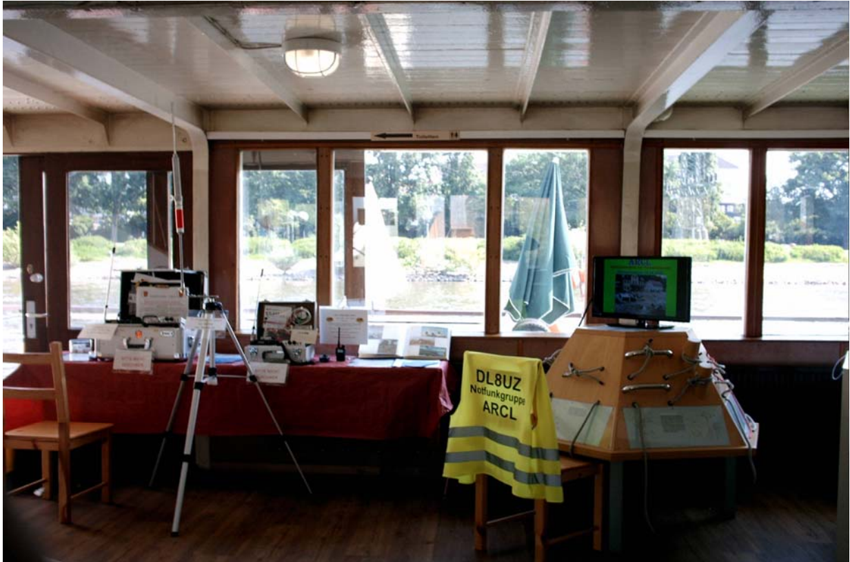
Hier der Ausstellungsbereich von DL8UZ und DO2PM Notfunkkoffer sowie Präsentation Amateurfunk von ARCL e.V. und OV K06 Ludwigshafen.