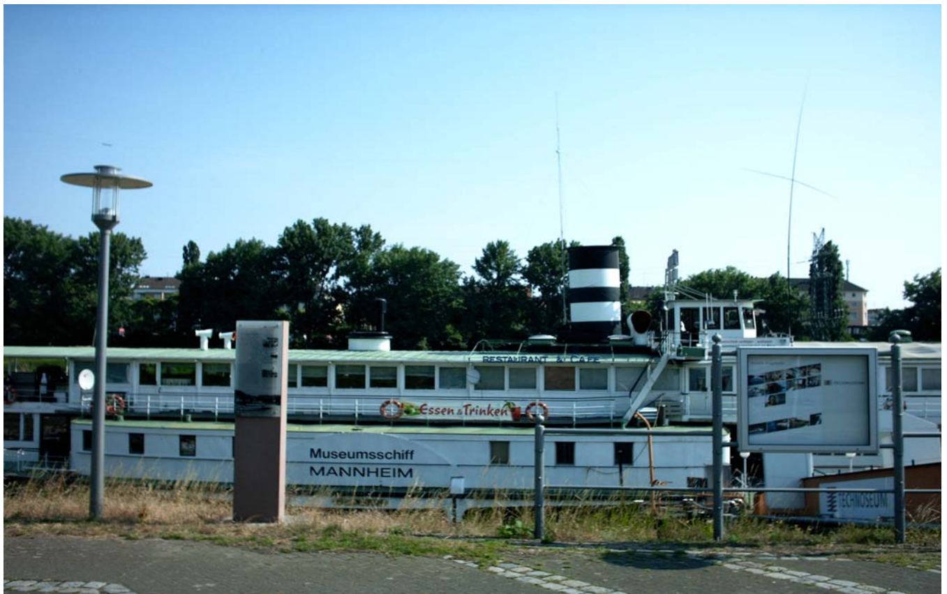
Hier das Museumsschiff „Schaufelraddampfer Mannheim“ am Neckar mit Restaurant.

Ach ja, es wurden 220 QSOs weltweit durchgeführt und meiner Einer lieferte noch zu guter letzt Japan.